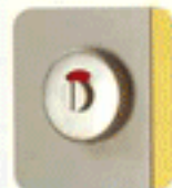
Cerradura con señalización abierto/cerrado (vista exterior)