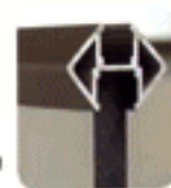
Perfil de conexión romboidal de aluminio