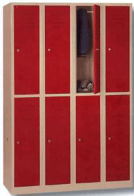
NOV 300 - 2 X 4