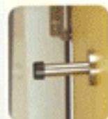
Tope de puerta / Colgador