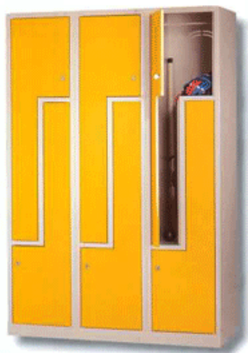
NOV 400 - 2 X 3 PL

La Serie 2PL, se forma a partir de módulos con dos puertas en forma de "L". Este tipo de puerta facilita el guardar objetos o prendas largas en sitios con poco espacio. Las cerradura se montan en los tramos anchos de las puertas, para aumentar la seguridad.