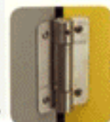
Opcional : se pueden suministrar las bisagras con cierre automático.