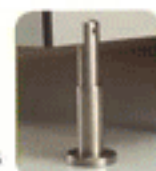
Pata regulable en altura