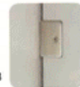
U fijación pared