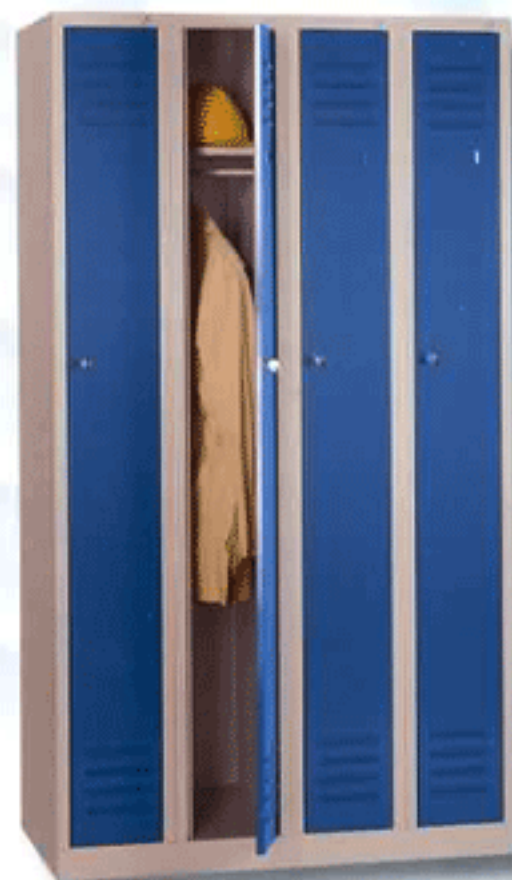
NOV 250 - 1 X 4