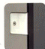
U fijación entre paneles