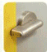
Cerradura y pomo (vista interior)