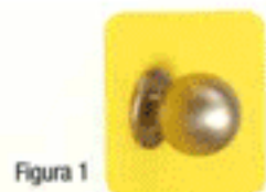
Pomo de bola