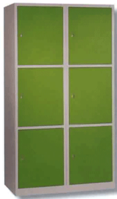
NOV 500 - 3 X 2